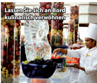
Lassen Sie sich an Bord kulinarisch verwöhnen

Unsere erfahrene, mehrfach weltreiseprobte und sprachgewandte Reiseleiterin freut sich darauf, Sie auf dieser Reise zu begleiten und Sie mit wichtigen Tipps und Hinweisen rund um Ihre Reise zu unterstützen. So wird Ihre Weltreise zum unvergessliche Erlebnis! * ab 30 Reiseteilnehmern