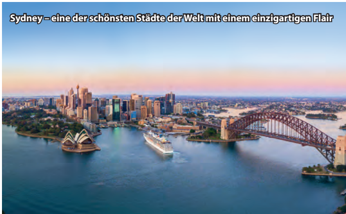
Sydney – eine der schönsten Städte der Welt mit einem einzigartigen Flair