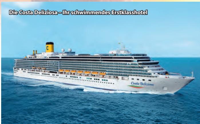
Die Costa Deliziosa – Ihr schwimmendes Erstklasshotel

Tischgetränke zu den Mahlzeiten inbegriffen!